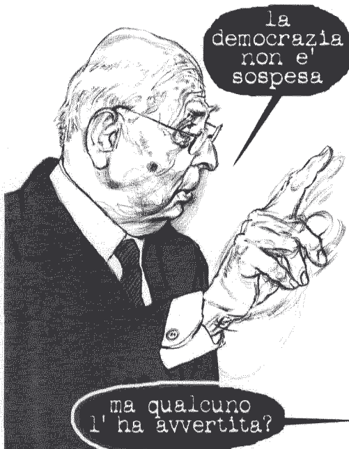
IL FATTO QUOTIDIANO, 2011